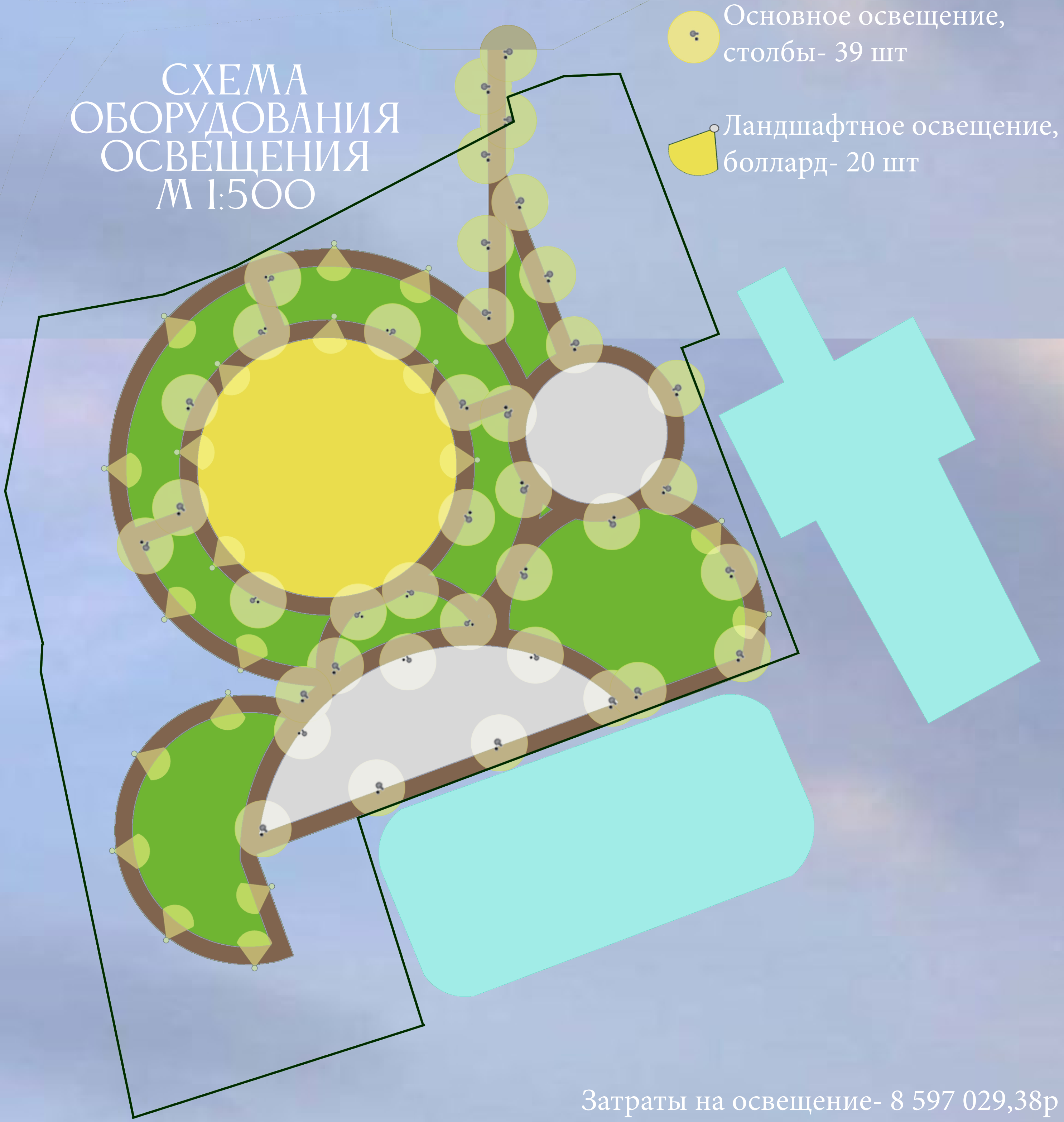
СХЕМА ОБОРУДОВАНИЯ ОСВЕЩЕНИЯ М 1:500

Озеленение: Крупномеры (до 4-х метров)- 5 шт Многолетние растения- 62 шт Кустарники- 51 шт Затраты на озеленение- 1 252 784,42р